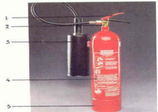
Πυροσβεστήρας διοξειδίου του άνθρακα (CO 2 ) 6 χιλιογράμμων

1. Μηχανισμός εκτόξευσης 2. Βαλβίδα υπερπίεσης (ασφάλειας) 3. Χοάνη και σωλήνας από σκληρό πλαστικό 4. Πινακίδα με τεχνικά και λοιπά στοιχεία του πυροσβεστήρα 5. Σταθερή βάση