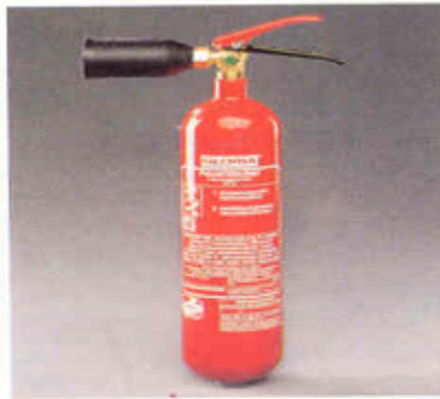
Πυροσβεστήρας διοξειδίου του άνθρακα (CO 2 ) 2 χιλιογράμμων