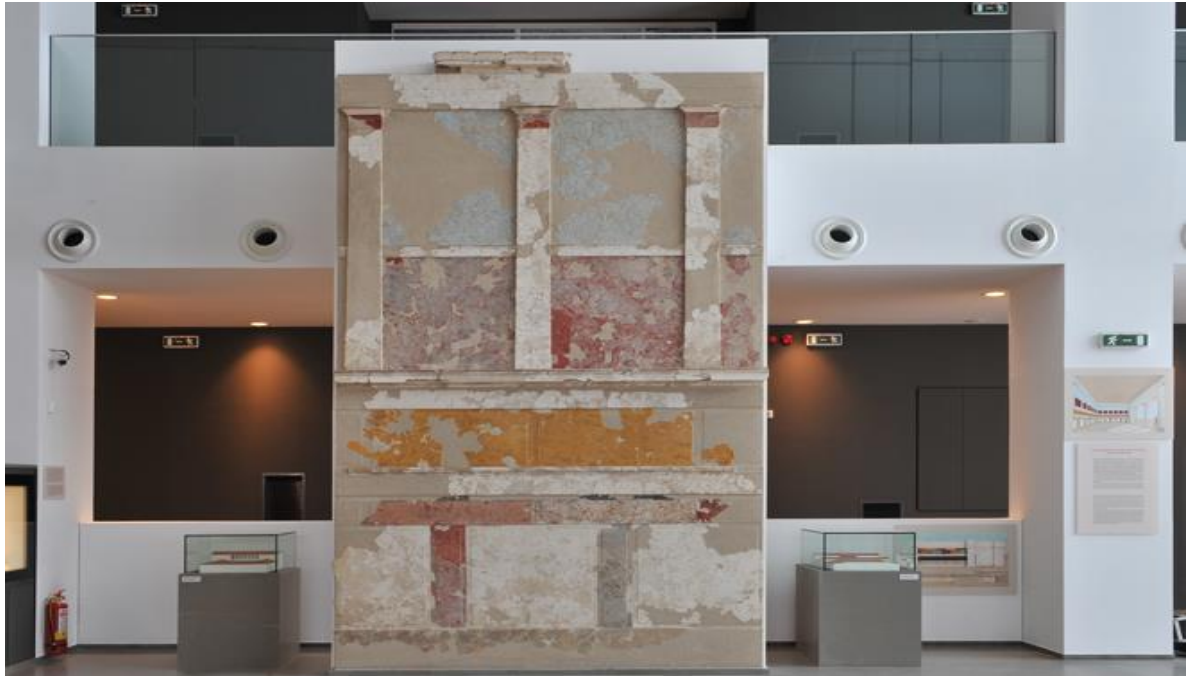
Αποκατάσταση τοίχου διώροφης οικίας με πολύχρωμα κονιάματα.