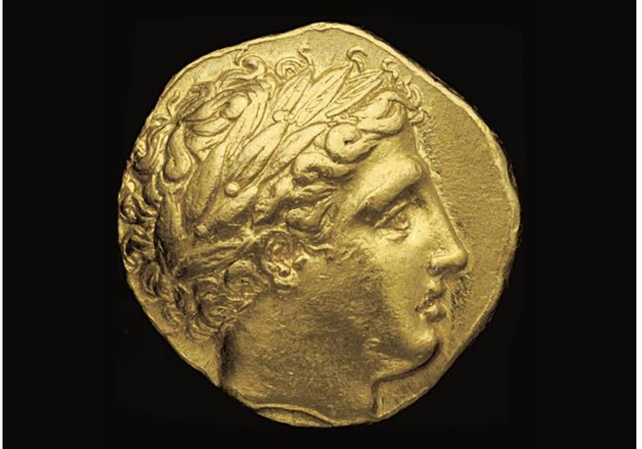
Εμπροσθότυπος χρυσού στατήρα Φιλίππου Β΄ με δαφνοστεφανωμένη κεφαλή του Απόλλωνα, 340-328 π.Χ.