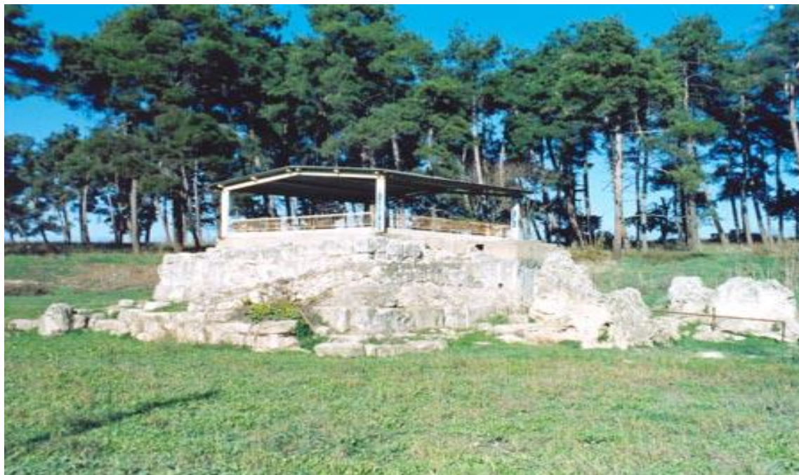
Η Ρωμαϊκή Αποικία της Πέλλας. Τα Λουτρά του Μεγάλου Αλεξάνδρου