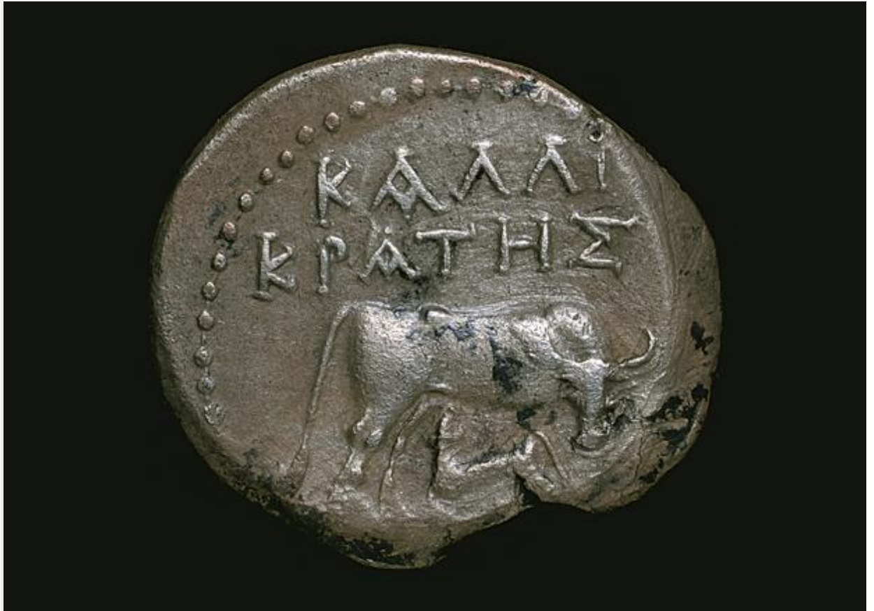
Εμπροσθότυπος αργυρού νομίσματος Δυρραχίου με μορφή αγελάδας σε θηλασμό και το όνομα του άρχοντα Καλλικράτη επάνω. 200-30 π.Χ.