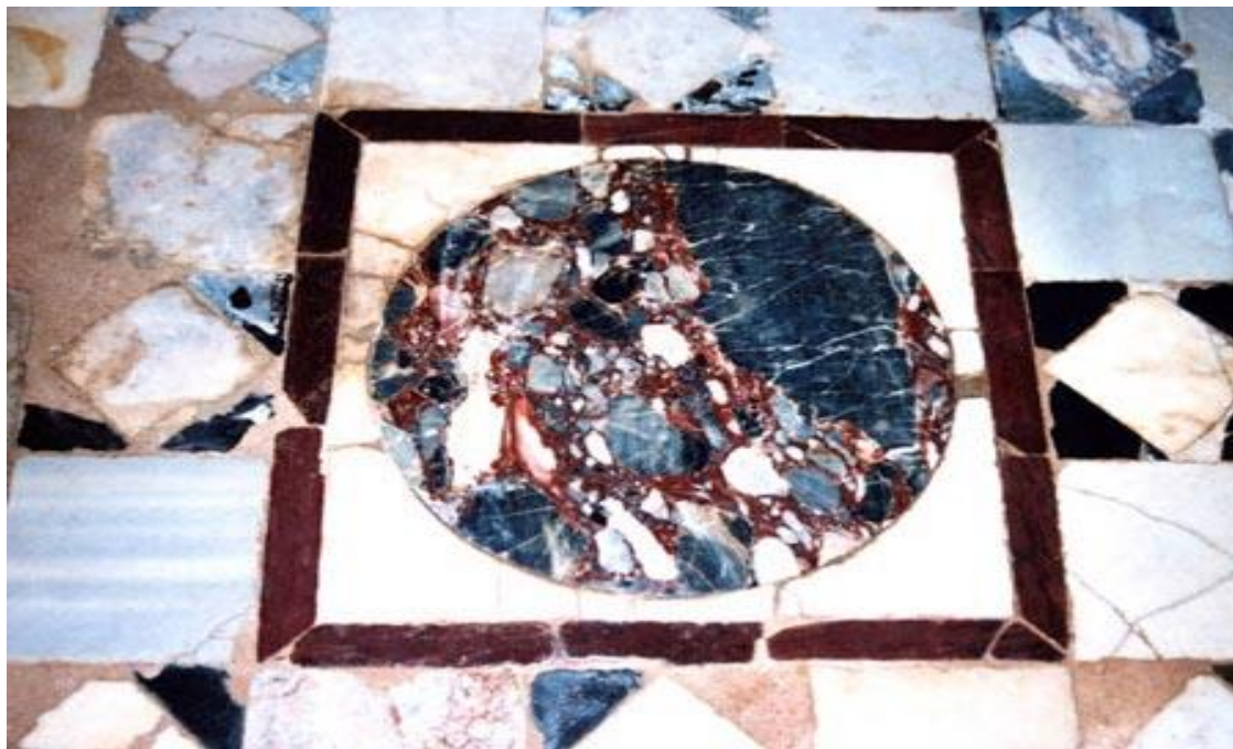
Η Ρωμαϊκή Αποικία της Πέλλας. Μαρμαροθέτημα Νάρθηκα Παλαιοχριστιανικής Βασιλικής Νέας Πέλλας

Η πρόσφατη ανασκαφική έρευνα αποκάλυψε βόρεια «των Λουτρών του Μεγάλου Αλεξάνδρου» έναν μεγαλοπρεπή ναό διαστάσεων 42,50 X 20,20μ.. Ακολουθεί τον τύπο της τρίκλιτης ξυλόστεγης βασιλικής με νάρθηκα, εξωνάρθηκα και αίθριο. Ο ναός ιδρύθηκε στο δεύτερο μισό του 5ου αιώνα και καταστράφηκε στις αρχές του 7ου αιώνα. Εντασσόταν σε ένα ευρύτερο μνημειακό συγκρότημα, το οποίο περικλειόταν από οχυρωματική περίβολο. Έφερε περίτεχνη επιδαπέδια διακόσμηση από ωραίο, πολύχρωμο μαρμαροθέτημα και ψηφιδωτό με γεωμερικό θεματολόγιο. Δεν γνωρίζουμε την ακριβή αιτία της καταστροφής του. Ήταν όμως αιφνίδια και ισχυρή, ίσως να προήλθε από σεισμό. Το μνημειακό συγκρότημα συνέχισε να χρησιμοποιείται και μετά την καταστροφή με οικιστική όμως και όχι λατρευτική χρήση ενώ ο μονόχωρος ναΐσκος που αποκαλύφθηκε δυτικά της βασιλικής χρονολογείται στην Υστεροβυζαντινή Εποχή.