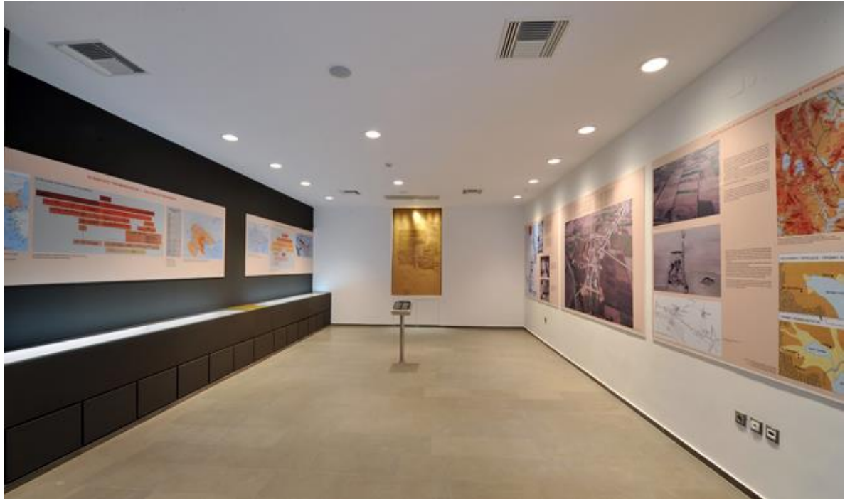
Ισόγειο Αρχ/κού Μουσείου Πέλλας: Αίθουσα με ποικίλο εποπτικό υλικό για την εξοικείωση του επισκέπτη με τον αρχαιολογικό χώρο, τη διαχρονική εξέλιξη και την ιστορία της περιοχής της Πέλλας.