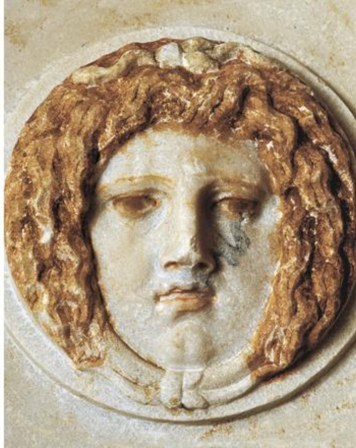
Ανάγλυφο γοργόνειο (κεφαλή της γοργόνας Μέδουσας) του «ωραίου τύπου». Μετά το 322 π.Χ