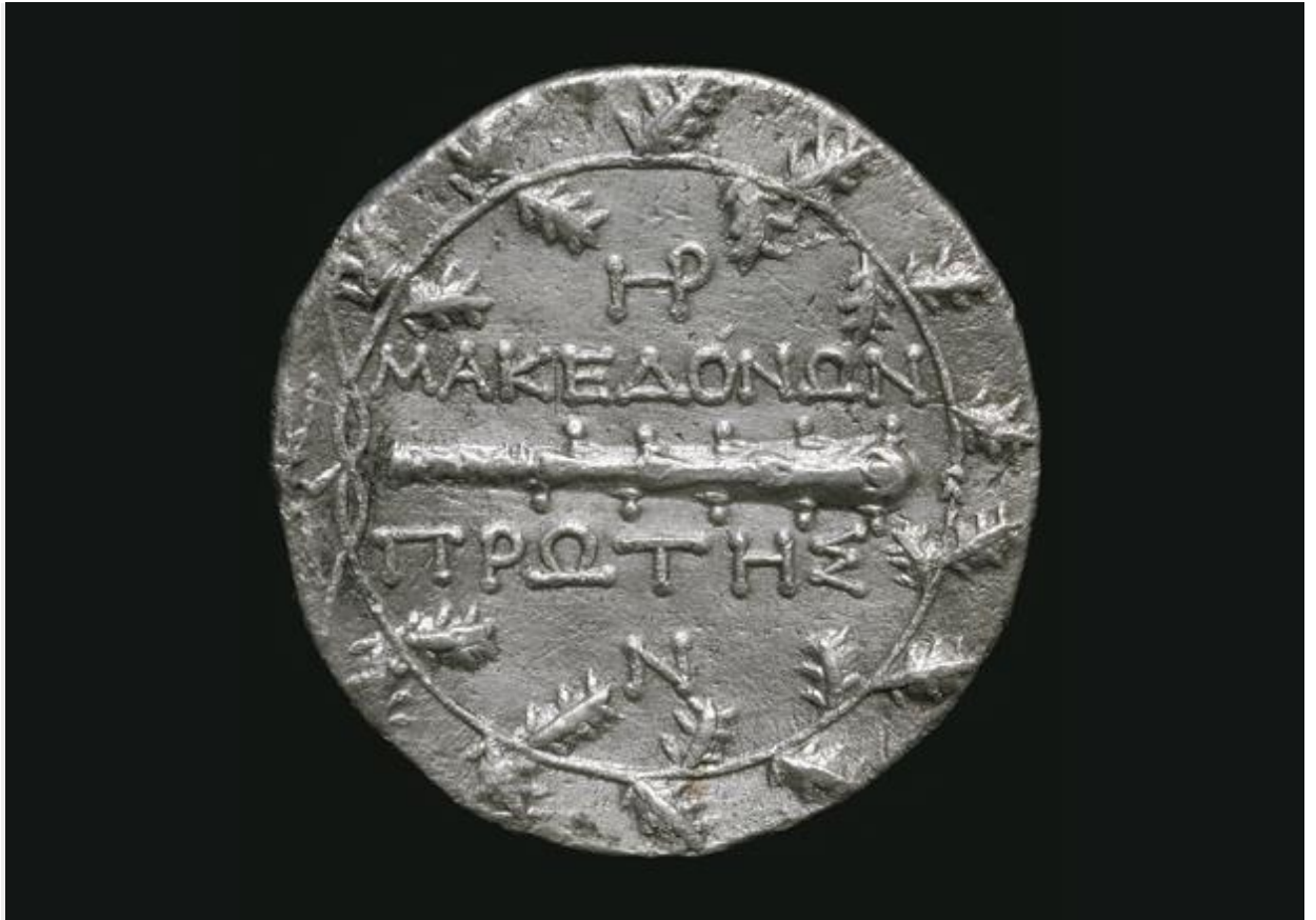
Οπισθότυπος τετραδράχμου κοινού Μακεδόνων με ρόπαλο σε στεφάνι βελανιδιάς και κεραυνό αριστερά, 158-150 π.Χ.