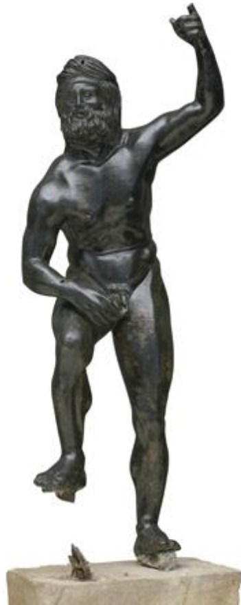
Χάλκινο αγαλμάτιο του θεού Ποσειδώνα, που κρατούσε τρίαινα. Αντιγράφει γνωστό τύπο αγάλματος του θεού, που φιλοτέχνησε ο Λύσιππος. Ελληνιστική εποχή.