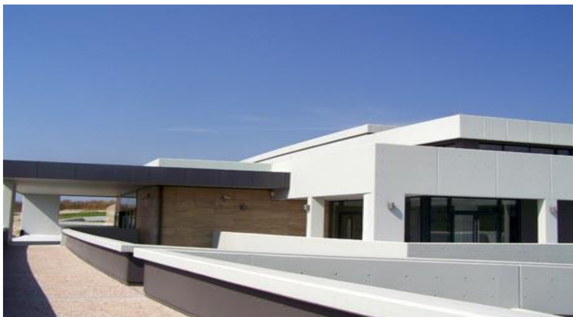
Το Αρχαιολογικό Μουσείο Πέλλας. Οι διακριτικοί όγκοι, οι λιτές γραμμές του κτηρίου είναι απόλυτα προσαρμοσμένοι στη μορφολογία του εδάφους.

Το Αρχαιολογικό Μουσείο της Πέλλας βρίσκεται δυτικά του σύγχρονου οικισμού, στο βορειοανατολικό τμήμα του επισκέψιμου αρχαιολογικού χώρου. Οι διακριτικοί όγκοι, οι λιτές γραμμές του κτηρίου είναι απόλυτα προσαρμοσμένοι στη μορφολογία του εδάφους.