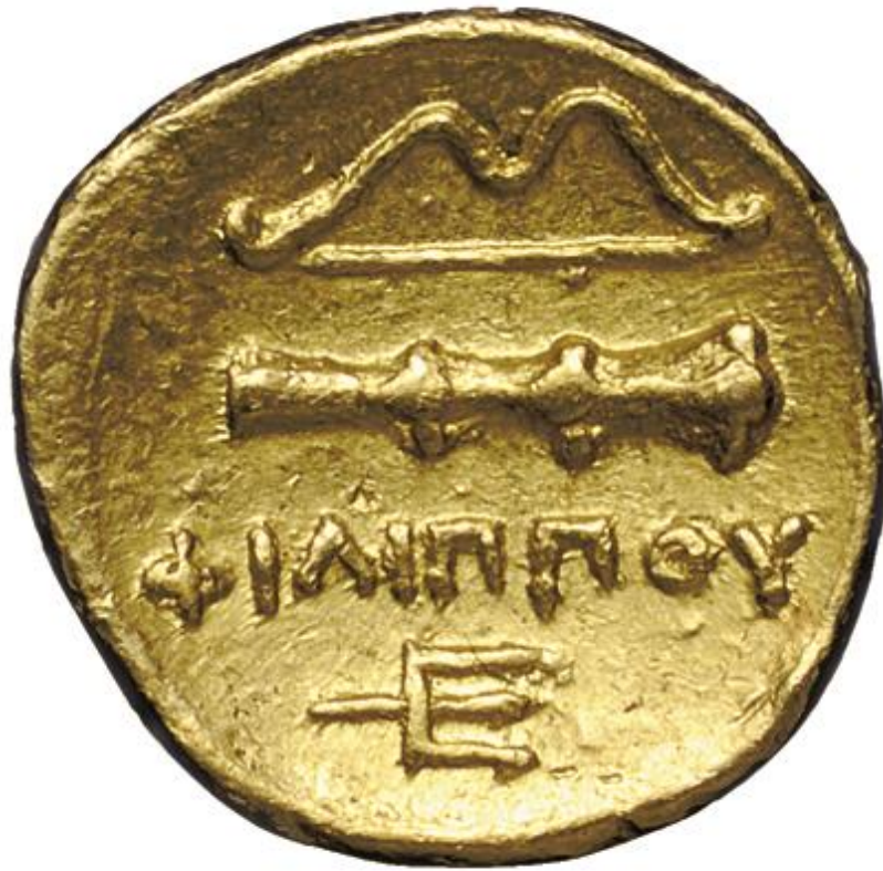
Οπισθότυπος χρυσού τετάρτου στατήρα Φιλίππου Β, 340-328 π.Χ