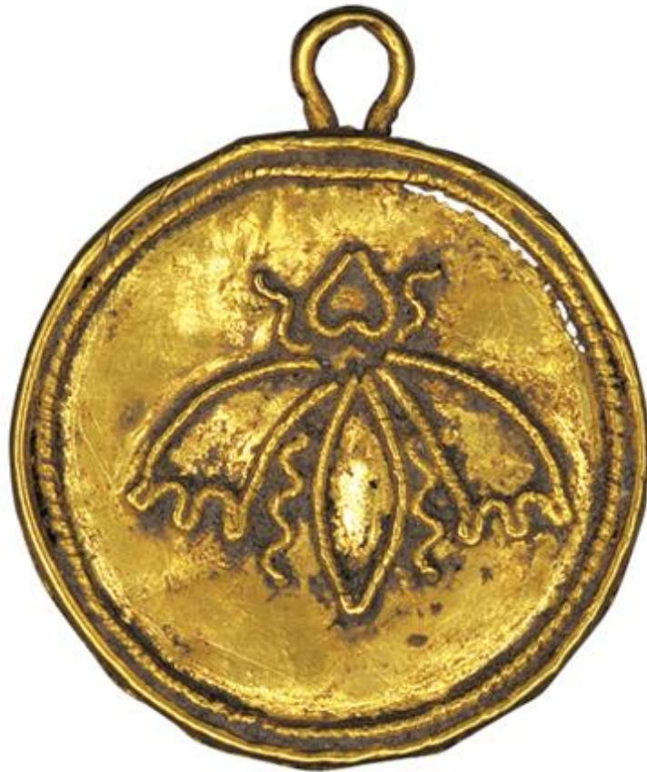
Χρυσό περίαπτο. Β΄ μισό του 4ου αι. π.Χ.