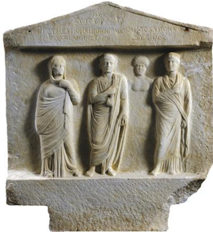
Μαρμάρινη ανάγλυφη ενεπίγραφη επιτύμβια αετωματική στήλη. Στήθηκε το 34 μ.Χ. όπως μας πληροφορεί η επιγραφή.