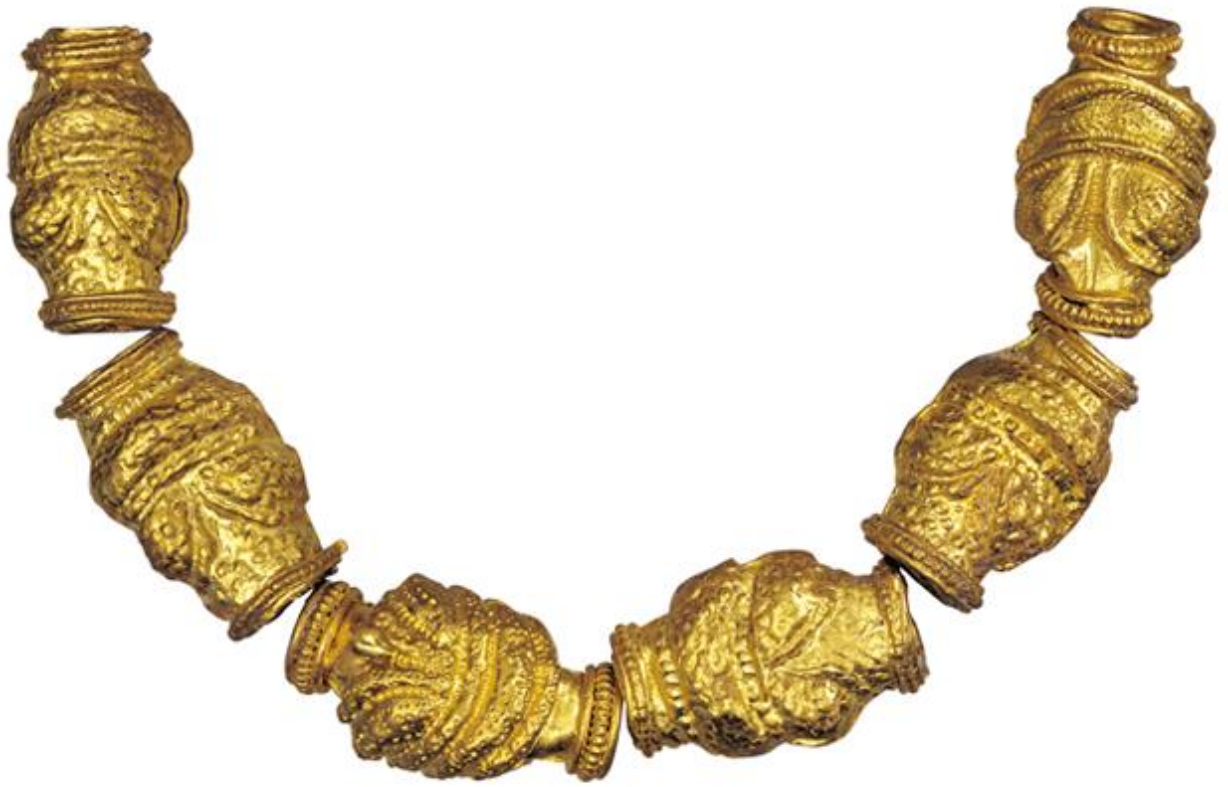
Χρυσές χάνδρες περιδεραιίου. Β΄μισό του 4ου αι. π.Χ.