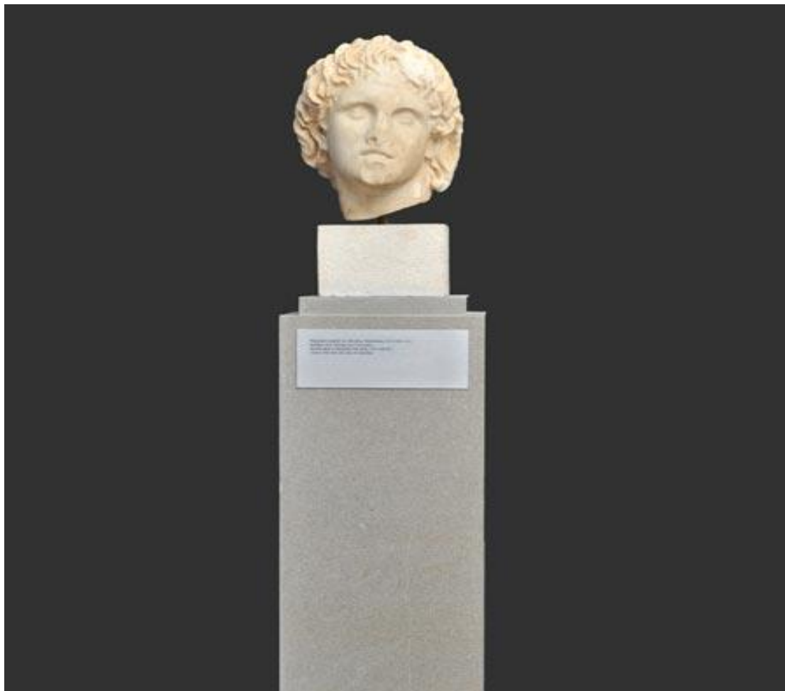
Το Αρχαιολογικό Μουσείο Πέλλας. Η μαρμάρινη κεφαλή του Αλεξάνδρου Γ'.

με διαδραστικό τρόπο αντιλαμβάνεται και κατανοεί την ανάπτυξη της πόλης. Στη συνέχεια, η μαρμάρινη κεφαλή του Αλεξάνδρου Γ' και το μαρμάρινο αγαλμάτιο του Αλεξάνδρου-Πάνα οδηγούν τον επισκέπτη στο κύριο τμήμα του μουσείου.