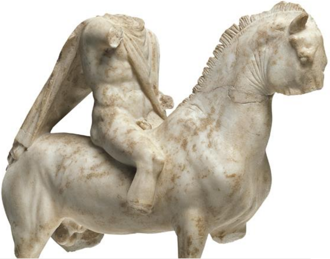
Μαρμάρινο αγαλμάτιο ιππέα. Ελληνιστική εποχή.