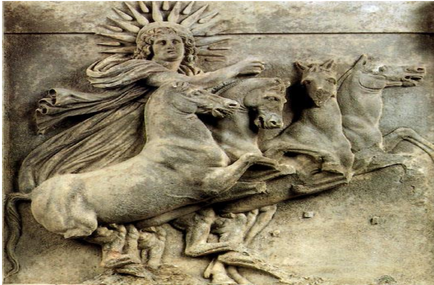
Ήλιος της Βεργίνας σε ανάγλυφο που απεικονίζει τον θεό Ήλιο στο άρμα του, αρχές 4ου αι. π.Χ., νάος Αθηνάς, Τροία

ηπειρωτική Ελλάδα, όπως στη Κέρκυρα, 5ος αιώνας π.Χ., Λοκρίδα, 4ο αιώνας π.Χ. Πριν το 1977 το σύμβολο θεωρείτο απλά διακοσμητικό στοιχείο. Έπειτα από την ανακάλυψη του Ανδρόνικου το σύμβολο άρχισε να συσχετίζεται με τους Αρχαίους Μακεδόνες, παρ' όλη τη πρωτέρα διακοσμητική του χρήση στην Ελληνική τέχνη.