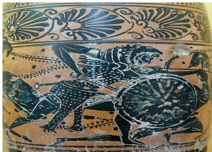
Ο ήλιος της Βεργίνας στην ασπίδα του Ηρακλή, λήκυθος, αρχές 5ου αι. π.Χ., ελληνική αποικία της Γέλα στην Σικελία