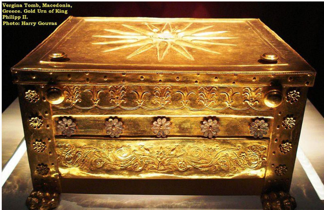
Vergina Tomb, Macedonia, Greece. Gold Urn of King Philip II.