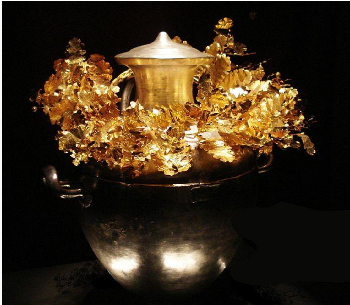
Ασημένια Λήκυθος με Χρυσό Στεφάνι, από τον ασύλητο τάφο III